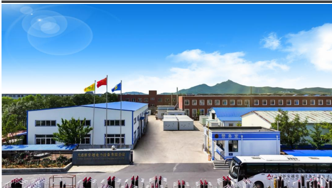
图 2-1 企业概貌