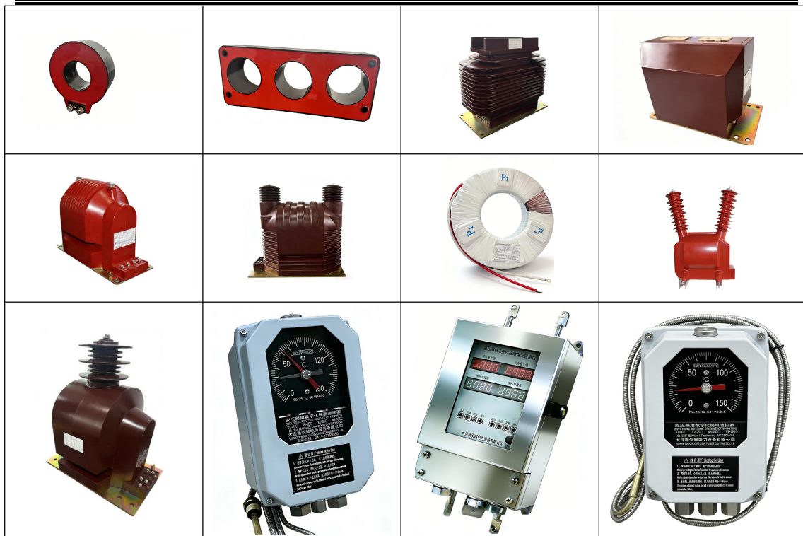
图 2-2 产品概貌